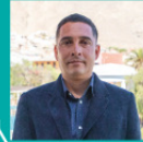
JOSÉ NADAL CERDA CULTURA, PATRIMONIO Y TURISMO