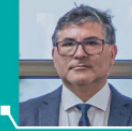
FELIX SOTO TORRIJO JUEZ DE POLICIA LOCAL