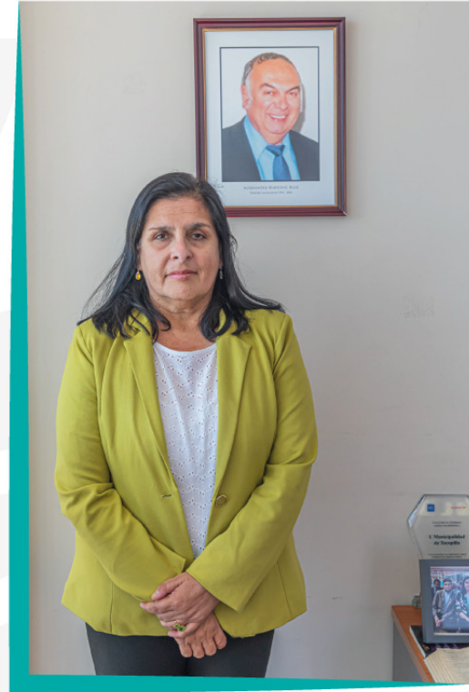
LJUBIČA KURTOVIC CORTÉS ALCALDESA

Esta labor es realizada con el objetivo de satisfacer las necesidades de la comunidad local, el desarrollo social y territorial, con la participación de los diversos actores sociales, culturales y económicos. Actualmente, a cargo del gobierno comunal está la Alcaldesa de Tocopilla, Ljubica Elena Kurtovic Cortés, acompañada del Honorable Concejo Municipal, integrado por las siguientes autoridades comunales