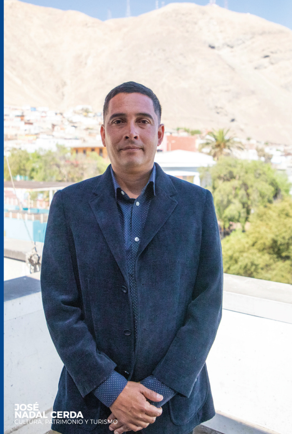
JOSÉ NADAL CERDA CULTURA, PATRIMONIO Y TURISMO