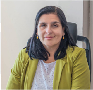
LJUBICA KURTOVIC CORTÉS. ALCALDESA

En tanto, para asegurar el funcionamiento de las distintas labores encomendadas en la administración municipal, la Municipalidad de Tocopilla cuenta con las siguientes unidades, las cuales se sigue contemplando mejoras a su estructura interna: