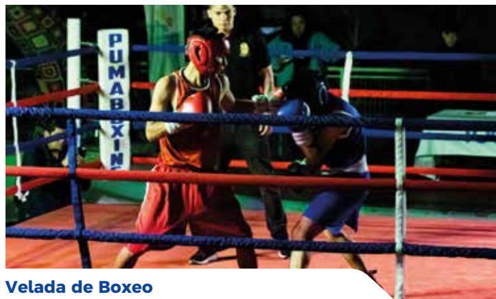
Velada de Boxeo