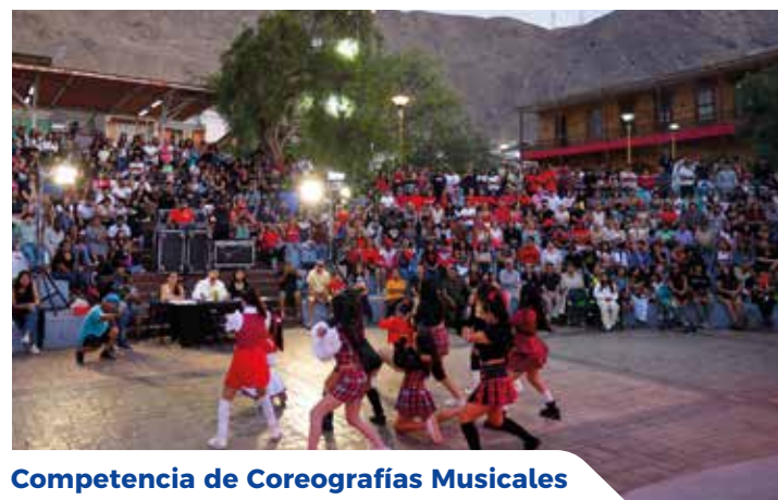
Competencia de Coreografías Musicales