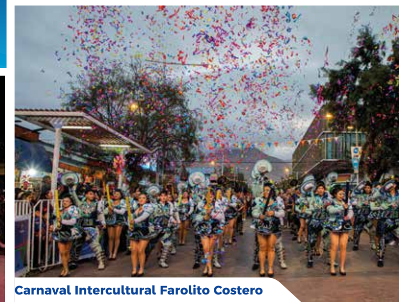
Carnaval Intercultural Farolito Costero