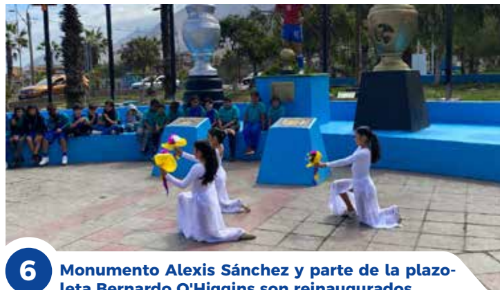
6 Monumento Alexis Sánchez y parte de la plaza-leta Bernardo O'Higgins son reinaugurados