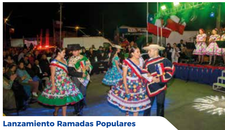
Lanzamiento Ramadas Populares