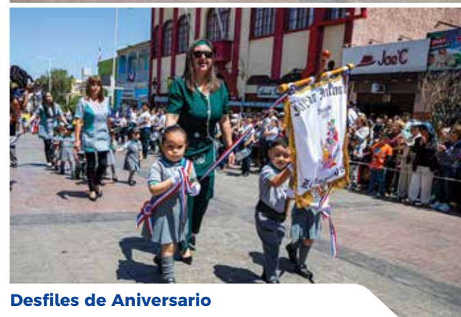
Desfiles de Aniversario