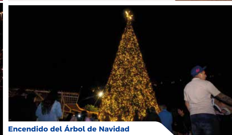
Encendido del Árbol de Navidad