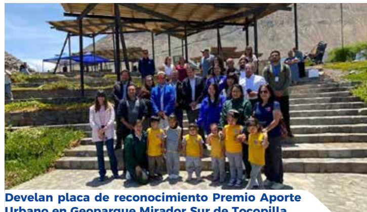
Develan placa de reconocimiento Premio Aporte Urbano en Geoparque Mirador Sur de Tocopilla