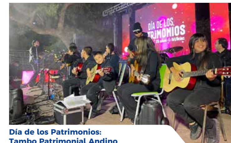
Día de los Patrimonios: Tambo Patrimonial Andino