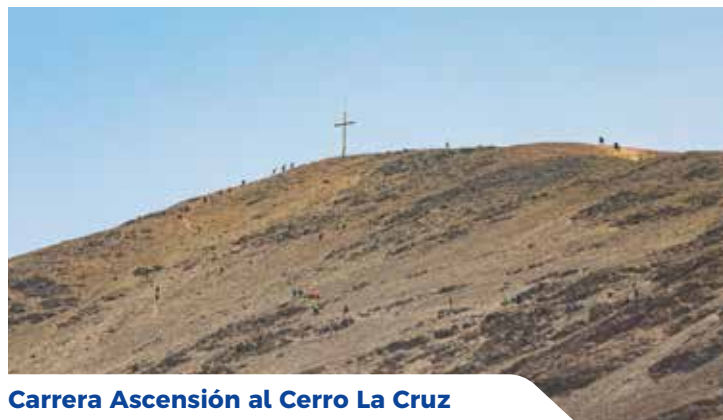
Carrera Ascensión al Cerro La Cruz

T ocopilla es una tierra muy especial, marcada por su gente y sus tradiciones, actividades y eventos propios, con los cuales queremos convertirnos en un destino destacado en la región. Por lo que hemos reforzado nuestra identidad cultural y patrimonial, lo cual queremos plasmar en las siguientes páginas, destacando los hitos más relevantes del año y los esfuerzos de la gestión municipal para impulsar el turismo y preservar nuestra historia.