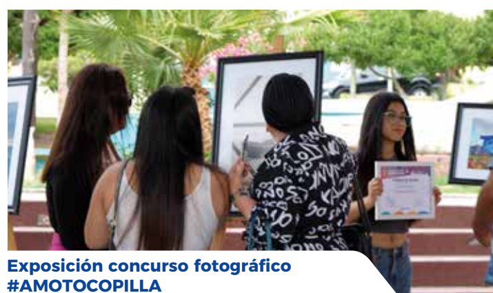
Exposición concurso fotográfico #AMOTOCOPILLA

T ocopilla es una tierra muy especial, marcada por su gente y sus tradiciones, actividades y eventos propios, con los cuales queremos convertirnos en un destino destacado en la región. Por lo que hemos reforzado nuestra identidad cultural y patrimonial, lo cual queremos plasmar en las siguientes páginas, destacando los hitos más relevantes del año y los esfuerzos de la gestión municipal para impulsar el turismo y preservar nuestra historia.