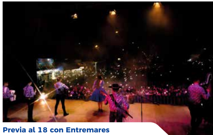
Previa al 18 con Entremares