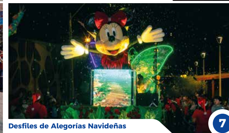
Desfiles de Alegorías Navideñas