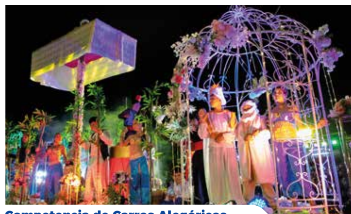
Competencia de Carros Alegóricos