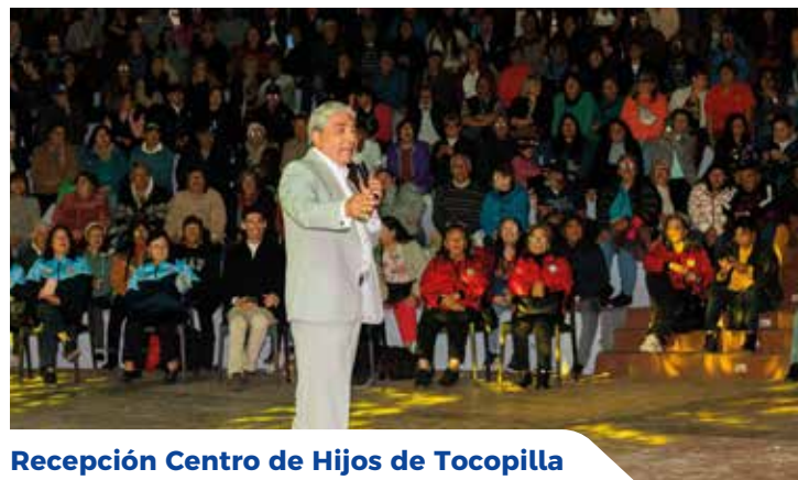
Recepción Centro de Hijos de Tocopilla