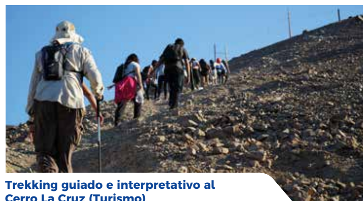
Trekking guiado e interpretativo al Cerro La Cruz (Turismo)